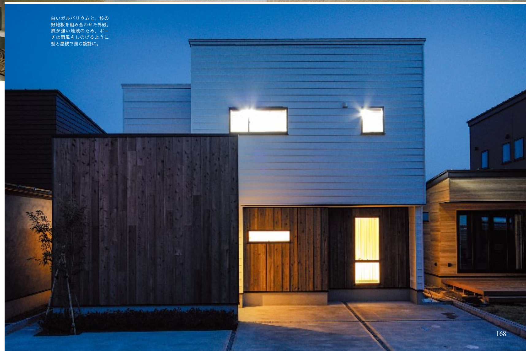
白いガルバリウムと、杉の野地板を組み合わせた外観。風が強い地域のため、ポーチは雨風をしのげるように壁と屋根で囲む設計に。