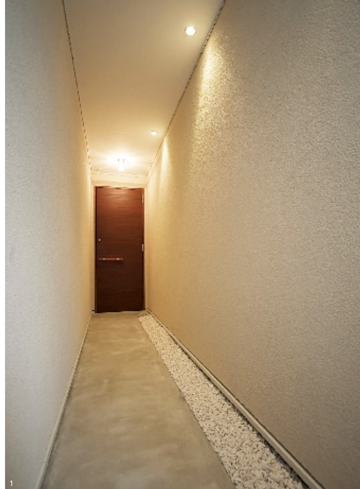
1.玄関へと続く長いアプローチはトンネルのような空間。2.客船をイメージした外観,2階のペランダは船のデッキを感じさせる。3.玄関ドアを開けるとライトアップされたオブジェや絵が目に飛び込んでくる。(写真は全て「Ship;neo-classical」)