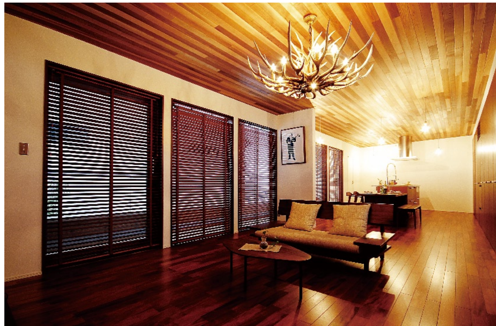
マホガニーで造られたオーダーメイドの木製サッシとピンカドの無垢フローリングを使用した斬新な造りのLDK。キッチンの壁面に設えた大容量の造作家具もオリジナル。(「Ship;neo-classical」)