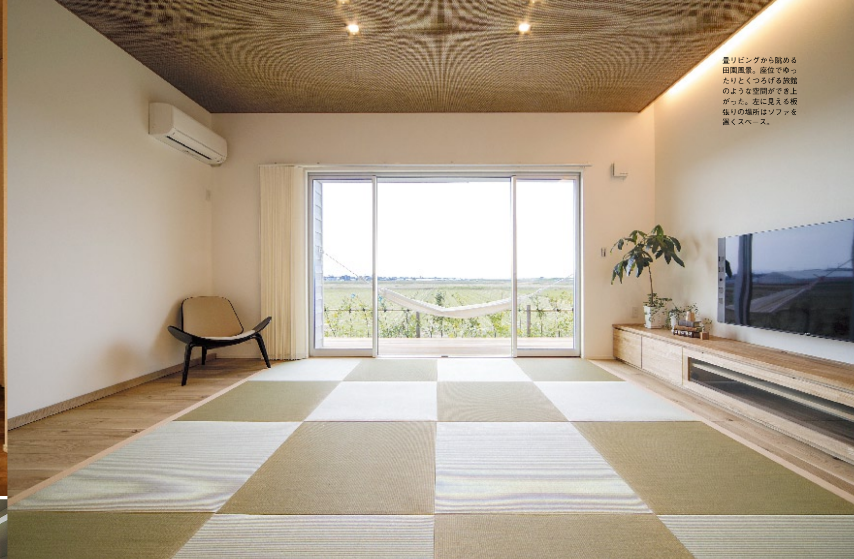
畳リビングから眺める田園風景。座地でゆったりとくつろげる旅館のような空間ができた。左に見える板張りの場所はソファを置くスペース。