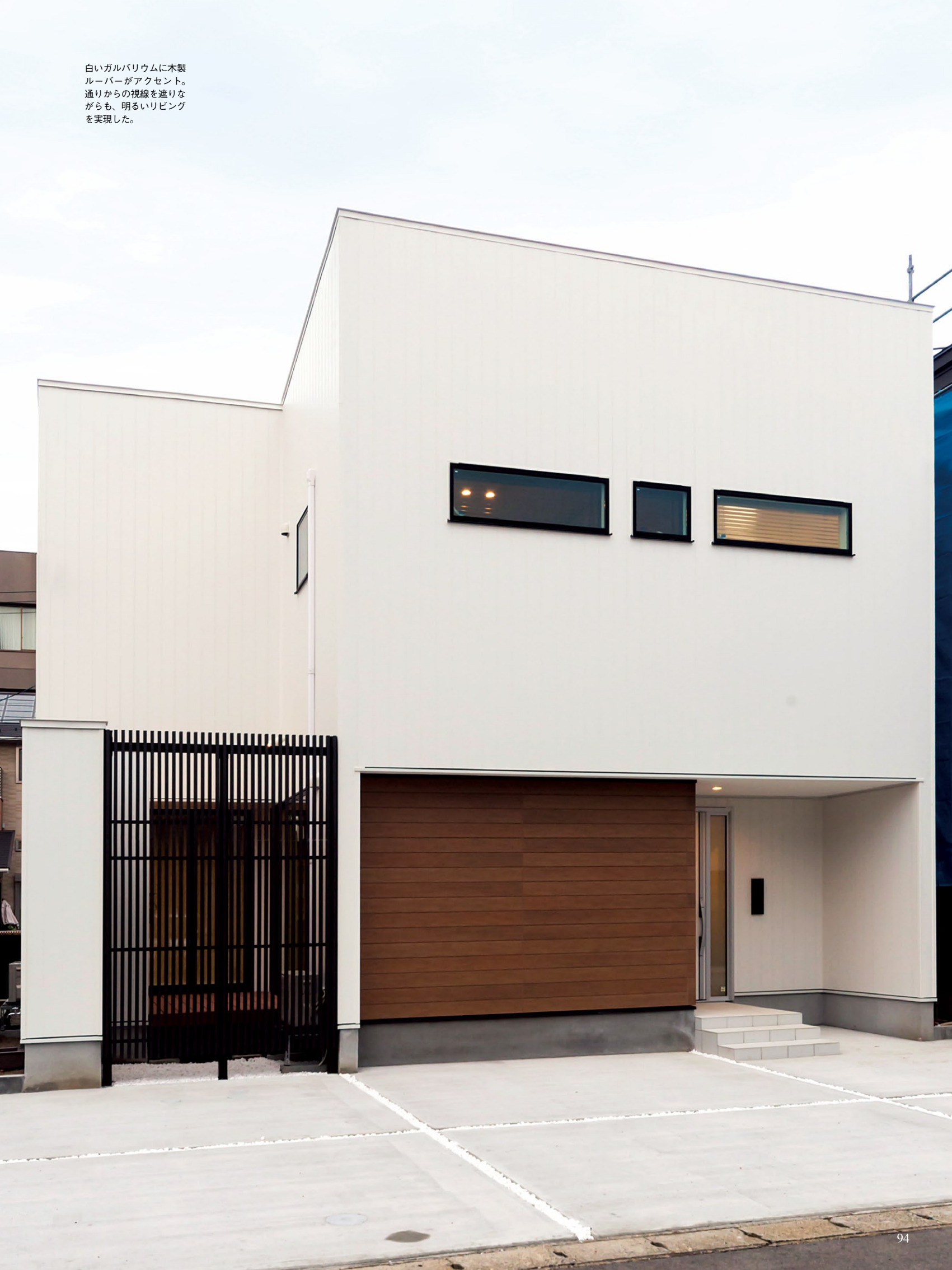
白いガルバリウムに木製ルーバーがアクセント。通りからの視線を遮りながらも、明るいリビングを実現した。

1.LDKを中心に和室、さらにはデッキへと繋がる32畳の大空間。リビングの壁一面のタイルが間接照明で美しく照らし出されている。2.幅広いウォルナットの無垢の床が高級感を感じさせるLDK。リビング部分は天井高を3mにして、開放感が感じられる造りにしている。3.リビングと繋がるテラスはプライベート感たっぷり。夏はバーベキューや夕涼みの空間に。4.2階浴室から眺めるバスコート。オリーブ、ワイヤープランツなどを組み合わせた寄せ植えが癒やしの空間を演出。露天風呂のような感覚で入浴を楽しめる。