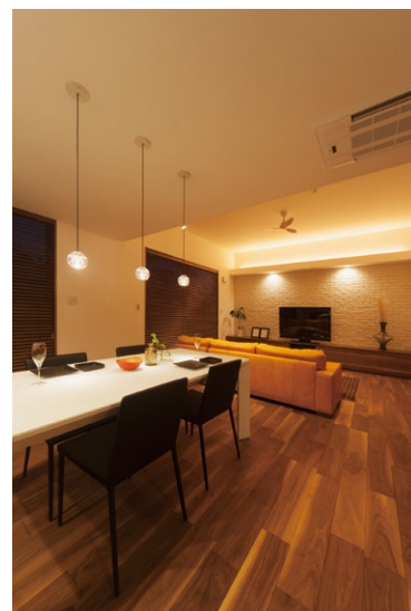
左/水平ラインを意識した外観はシンプルに仕上げるからこそ立体感が際立つ。 右/白いレンガ壁に反射する光、天井から降り注ぐ光、ペンダントで輝く光、毎日が光の競演。 ※写真は全て「HORIZON」