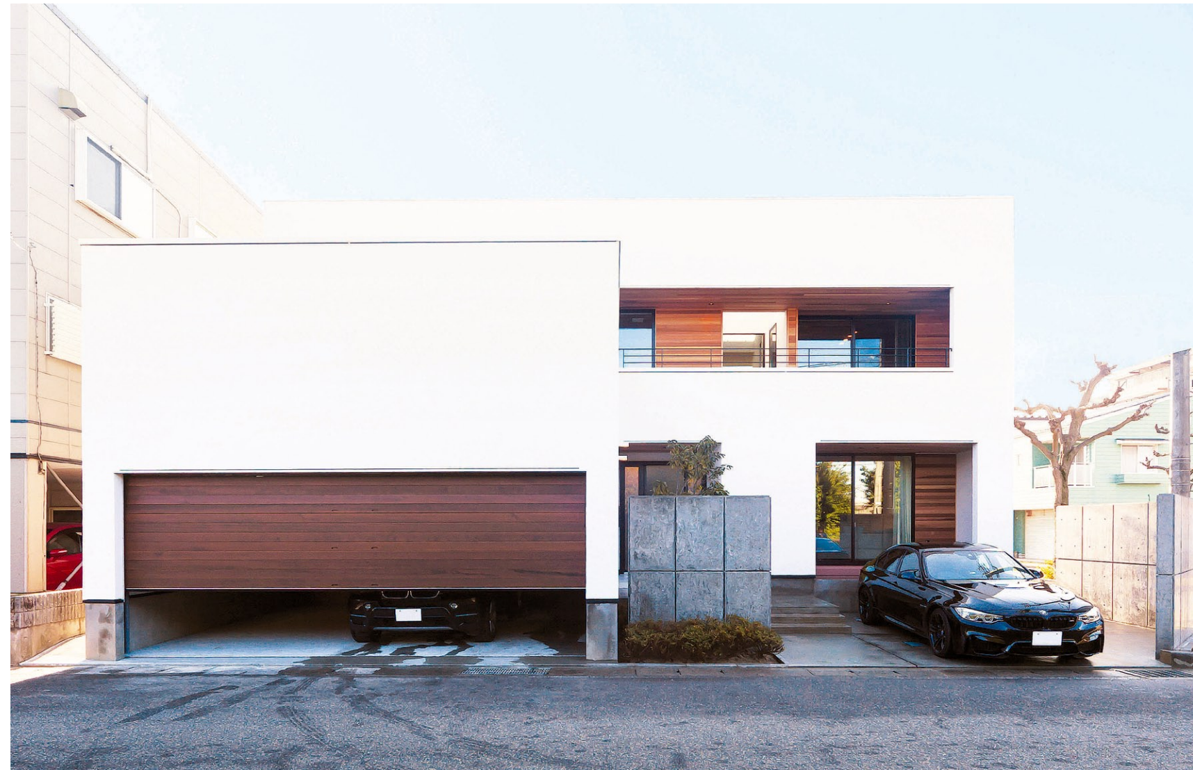
木製のガレージシャッターが上品な白い外壁のアクセント。(PREMIUM LOUNGE with terrace)